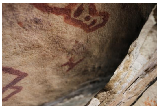
Figura 3. Desplazamiento de la superficie rocosa tras los movimientos telúricos de distintas épocas.