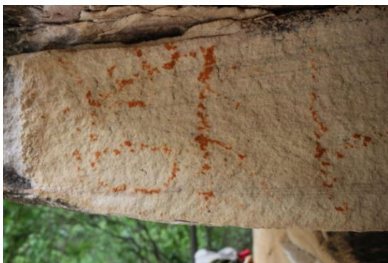
Figura 4. Pinturas ya casi imperceptibles en un panel vertical.