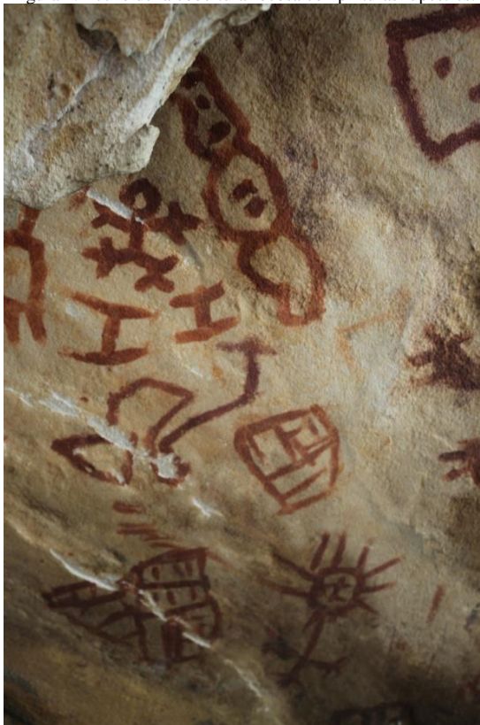
Figura 2. Detalle de las imágenes no figurativas.